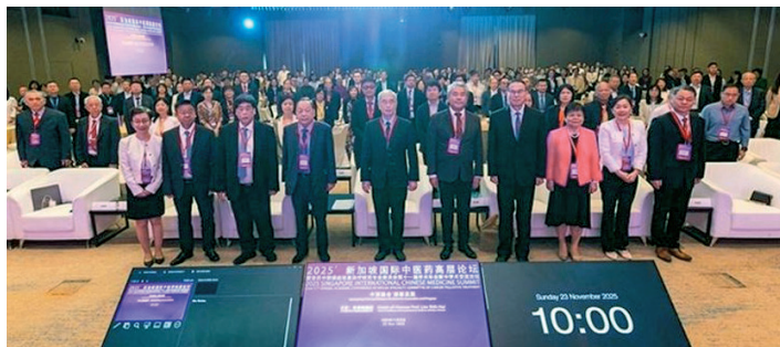
近300名海内外专家学者与会交流