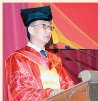
广州中医药大学副校长郭鸿致辞