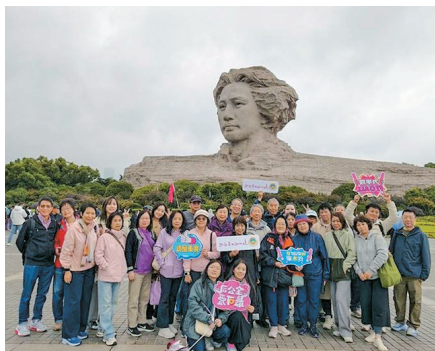
团员在橘子洲合影留念

2025年10月19日至23日，我院58名教职员工及家属，在董事会的组织与带领下，赴中国湖南开展了为期五天的文化参访与专业交流活动。