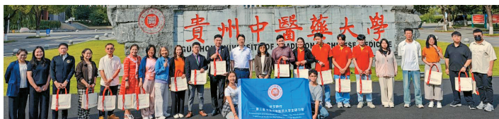
参与“针灸黔行——东盟传统医药大学生研习营”的新、马、泰的学员合影

此次研习深化了我院与东盟高校在中医药领域的相互了解，为青年学子提供了宝贵的学习交流平台，进一步推动了区域传统医药教育合作，意义深远。