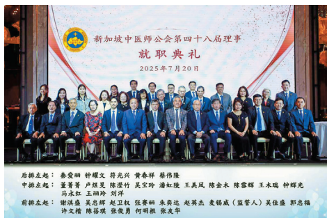
新加坡中医师公会第四十八届理事全体合影

此外，公会及属下机构顾问、法律顾问、中华医院与中医学院独立董事、各专业委员会成员、中华医院名誉院长、各友好团体代表与合作药商亦拨冗莅临，参与人数超过200人，气氛庄重而热烈。