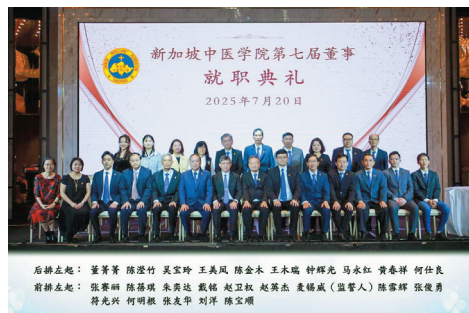
新加坡中医学院第七届董事全体合影