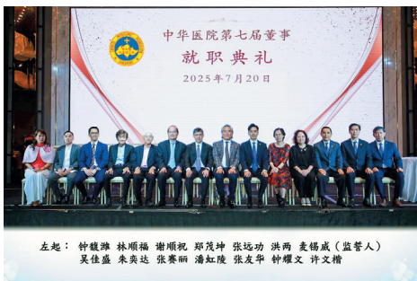
中华医院第七届董事全体合影