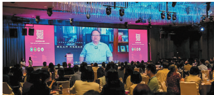
大会名誉主席周岱翰教授也上线致辞

2025年11月23日，“2025新加坡国际中医药高层论坛暨世界中联癌症姑息治疗研究专业委员会第十一届学术年会·新中学术交流论坛”在新加坡华乐酒店隆重举行。本次论坛以“中西融合，创新发展”为主题，由世界中医药学会联合会癌症姑息治疗研究专业委员会、新加坡中医师公会等五家机构联合主办，新加坡中医学院及广州中医药大学第一附属医院共同承办，近300名海内外专家学者与会交流。